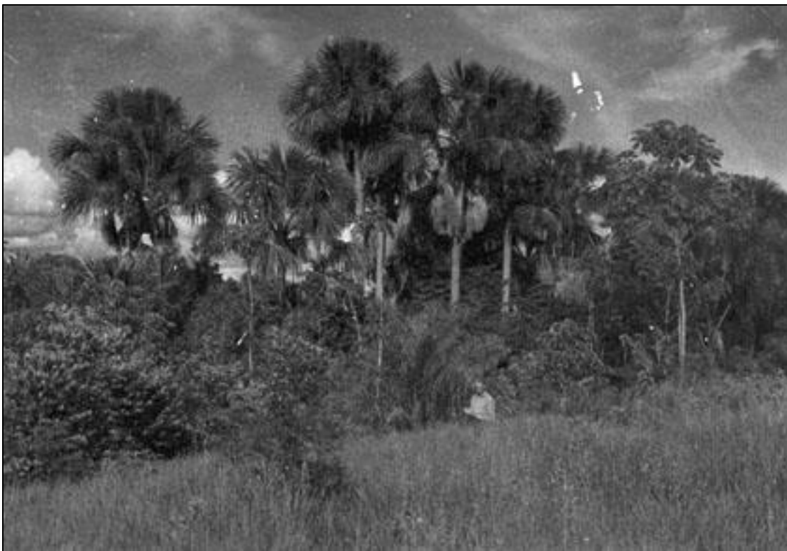
Figura 2. Buritizal perto de Peuva (MT).